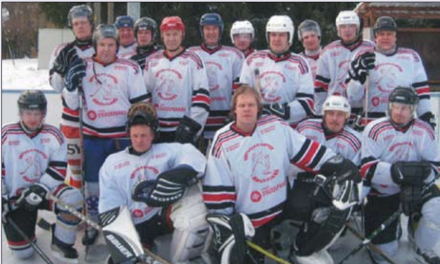
Nykyinen Broilers HT